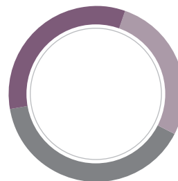
PAR ZONE GÉOGRAPHIQUE