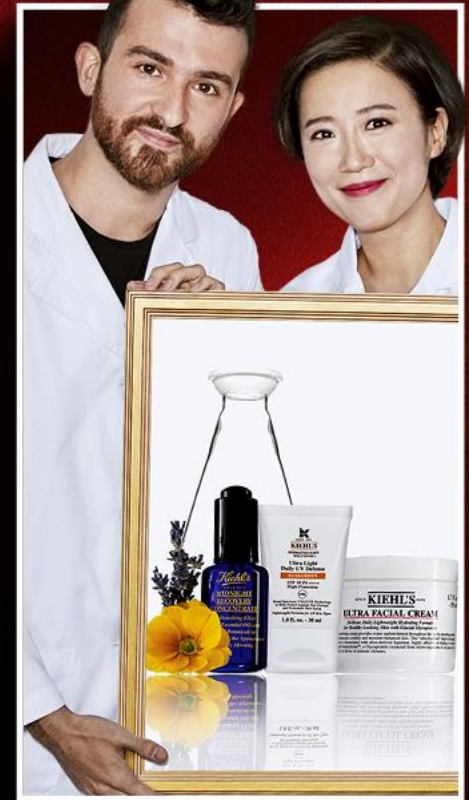
Kiehl's SINCE 1851