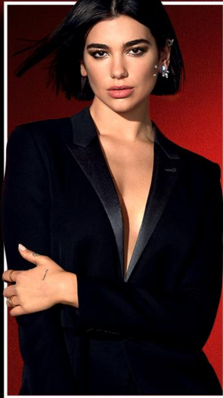
YVES SAINT LAURENT